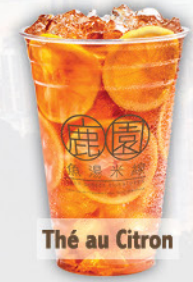
Thé au Citron