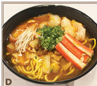
D Tom Yum Gong Thaïlandais + Filet de Poisson & Imitation de Crabe + Nouilles de Riz 泰式冬蔸功湯 + 鮮魚片、蟹柳 + 粗米線