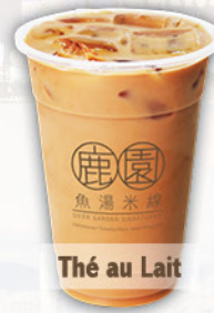
Thé au Lait