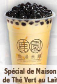
Spécial de Maison de Thé Vert au Lait avec Perle