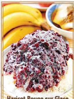
Haricot Rouge sur Glace