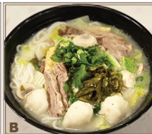
B Moutarde Marinée et Poivre + Tranches de Bœuf Braisé & Boulettes de Poisson + Nouilles de Riz 酸菜胡椒魚湯 + 牛腩、魚蛋 + 粗米線