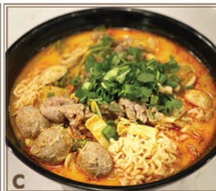
C Laksa Malaisien + Tranches de Bœuf Cuit & Boulettes de Bœuf + Nouille Instantanée 馬來喇沙湯 + 滑牛、牛丸 + 出前一丁