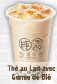
Thé au Lait avec Germe de Blé