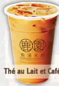
Thé au Lait et Café