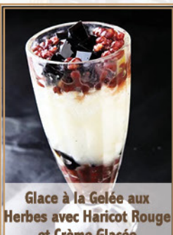
Glace à la Gelée aux Herbes avec Haricot Rouge et Crème Glacée