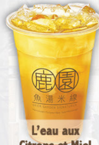
L'eau aux Citrons et Miel