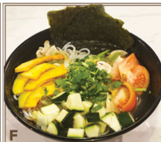
F Bouillon de Poulet + Tranches de Citrouille & Zucchini + Nouilles de Riz 清雞湯 + 南瓜片、意大利瓜 + 粗米線