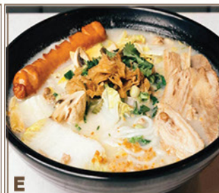
E Poisson Déshydraté et Porc Émincé au Style Chaozhou + Tranches de Bœuf Braisé & Saucisse Assaisonnée + Nouilles de Riz 潮式方魚肉碎魚湯 + 牛腩、脆皮腸 + 粗米線