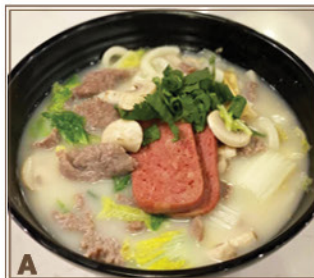
A Base de Soupe Originale + Tranches de Bœuf Cuit & Pain de Jambon Haché + U-don 原味魚湯 + 滑牛、午餐肉 + 扁冬